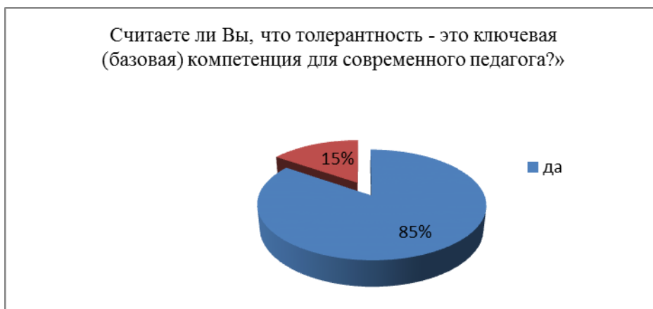
Рис. 2. Распределение ответов на вопрос «Считаете ли Вы, что толерантность – это ключевая (базовая) компетенция для современного педагога?»

Следующие мнения выразили учителя средней школы, методисты, преподаватели, научно-педагогические работники. На вопрос: «Считаете ли Вы, что толерантность – это ключевая (базовая) компетенция для современного педагога?» (рис. 2).